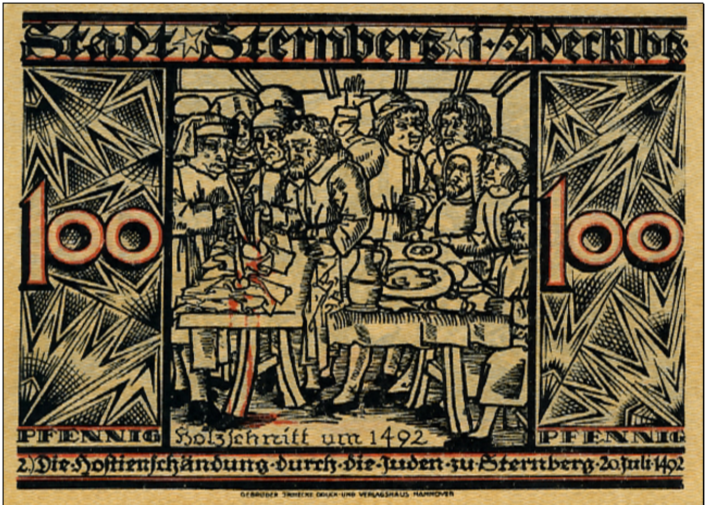
Motiv 2: Die Hostienschändung durch die Juden zu Sternberg, 20. Juli 1492