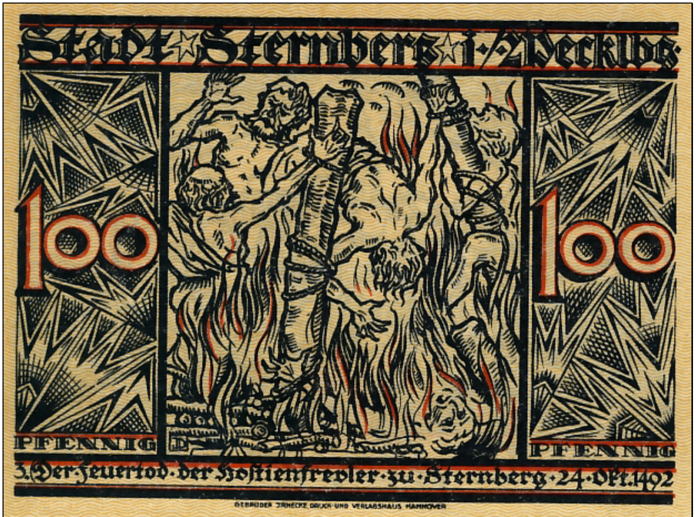
Motiv 3: Der Feuertod der Hostienfrevler zu Sternberg, 24. Oktober 1492